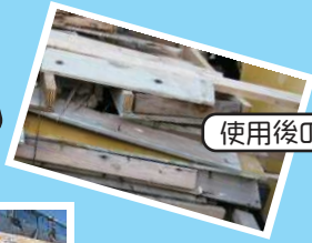
使用後の板材廃棄まで