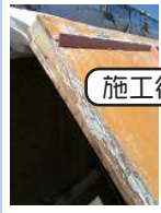
施工後のバリ取り...